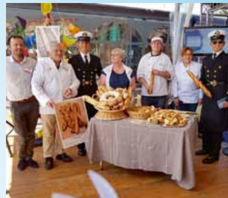
Les marins de l'Armada ont apprécié la baguette de tradition