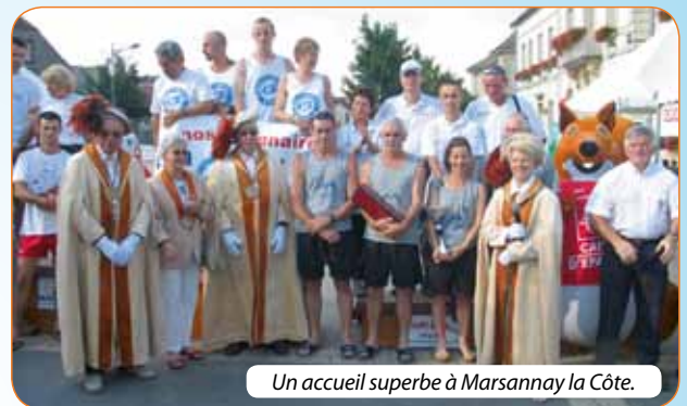
Un accueil superbe à Marsannay la Côte.