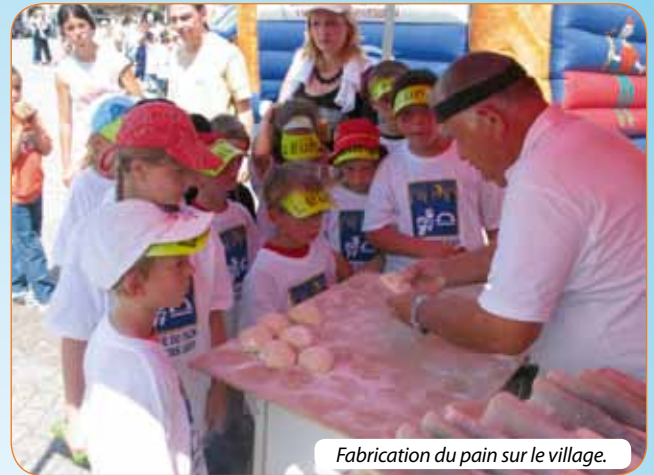
Fabrication du pain sur le village.