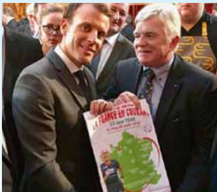
En portant la galette au Président de la République Dédé présente la France en Courant