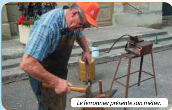
Le ferronnier présente son métier.