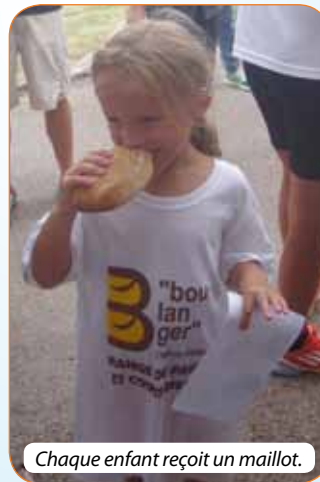
Chaque enfant reçoit un maillot.