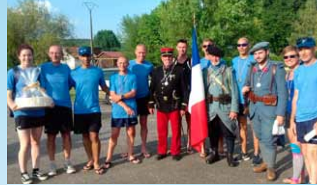
Le Team Défense Armée de Terre au départ de Verdun